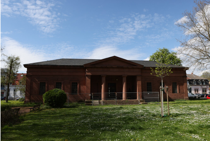
Friedenskapelle Kaiserslautern (2023)