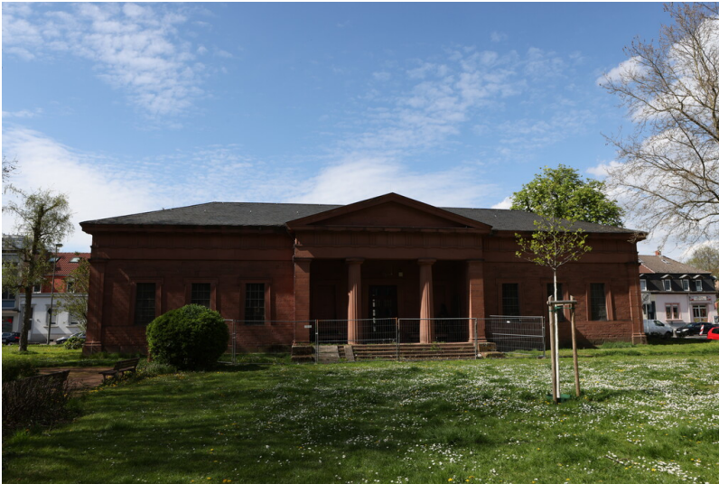
Friedenskapelle Kaiserslautern (2023)