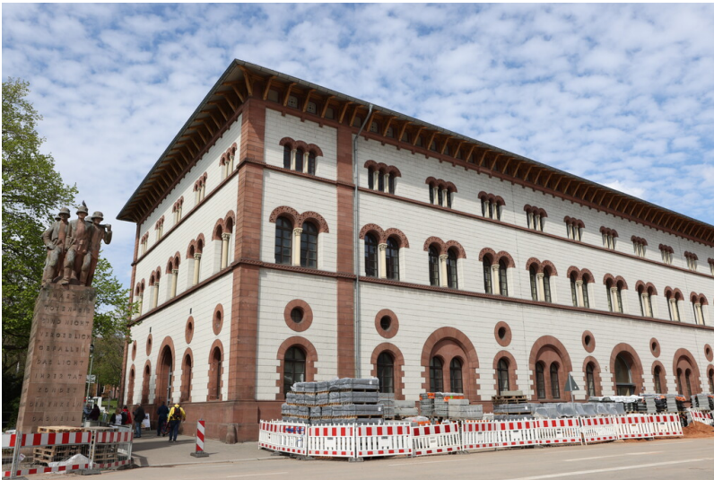
Fruchthalle Kaiserslautern (2023)