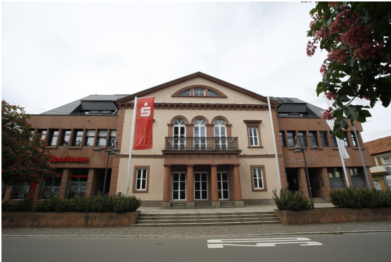
Rathaus von Herxheim bei Landau (2023)