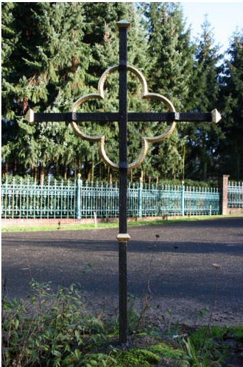
Aachener Wald Vierpasskreuz