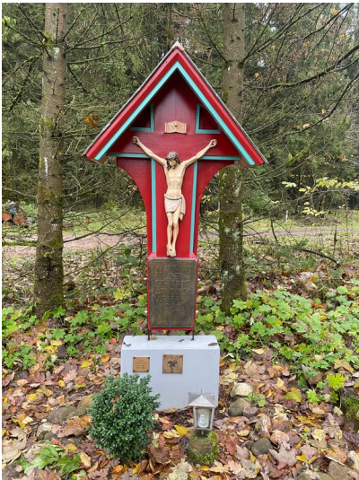
Pilgerkreuz der St. Matthias-Bruderschaft aus Düren-Arnoldsweiler in Schnorrenberg (2024)