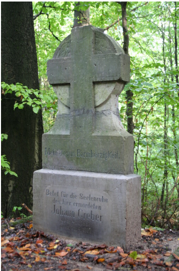
Aachener Wald Greberkreuz