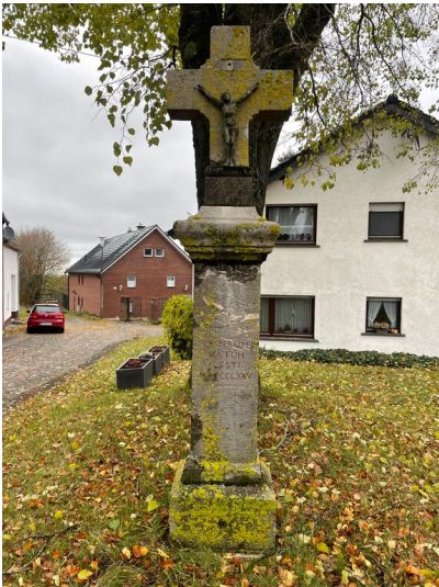
Wegekreuz in Rescheid (2024)