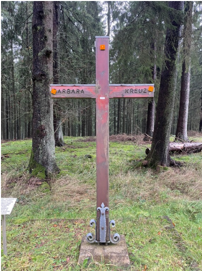
Barbarakreuz in Hellenthal (2024)