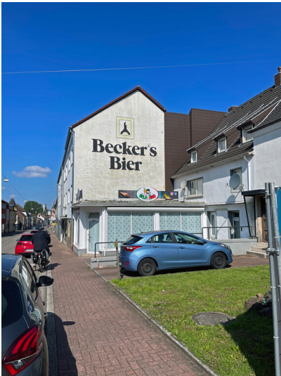
Becker Brauerei St. Ingbert (2024)