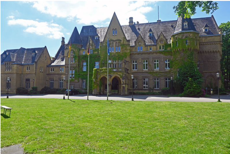
Schloss Halberg in Saarbrücken