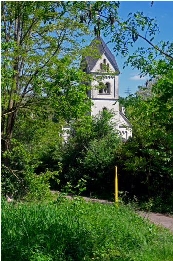
Stummsche Kirche in Saarbrücken (2024)