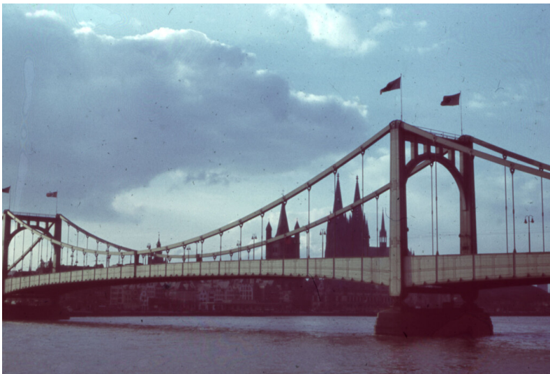
Historische Aufnahme der 1915 bis 1945 Deutz mit der Kölner Altstadt verbindenden Hängebrücke ("Hindenburgbrücke"). Auf den Pylonen gehisste Hakenkreuzflaggen lassen das Bild auf die Jahre 1933-1945 datieren.