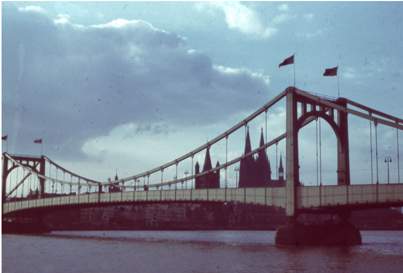
Historische Aufnahme der 1915 bis 1945 Deutz mit der Kölner Altstadt verbindenden Hängebrücke ("Hindenburgbrücke"). Auf den Pylonen gehisste Hakenkreuzflaggen lassen das Bild auf die Jahre 1933-1945 datieren.