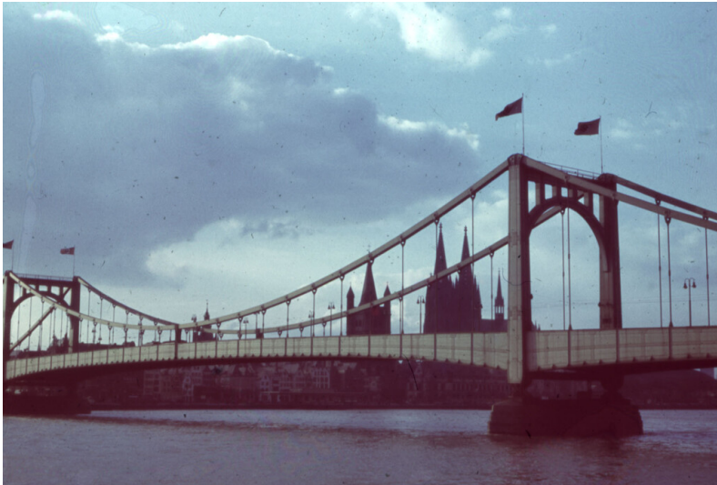
Historische Aufnahme der 1915 bis 1945 Deutz mit der Kölner Altstadt verbindenden Hängebrücke ("Hindenburgbrücke"). Auf den Pylonen gehisste Hakenkreuzflaggen lassen das Bild auf die Jahre 1933-1945 datieren.