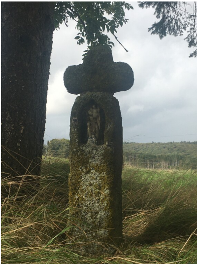
Wegekreuz "Schmugglerkreuz" aus Tuffstein in Steffeln (2023)