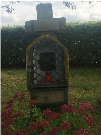
Dellkreuz (2023)