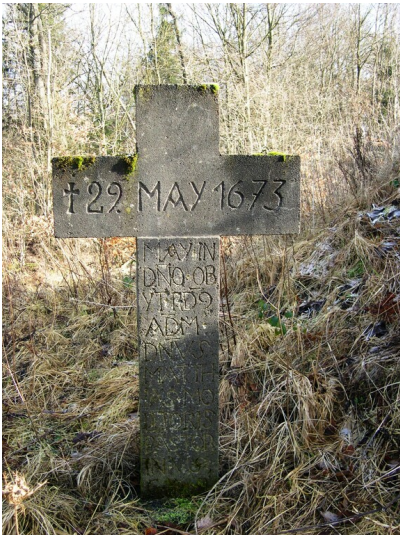
Gedenkkreuz für Pastor Molitor