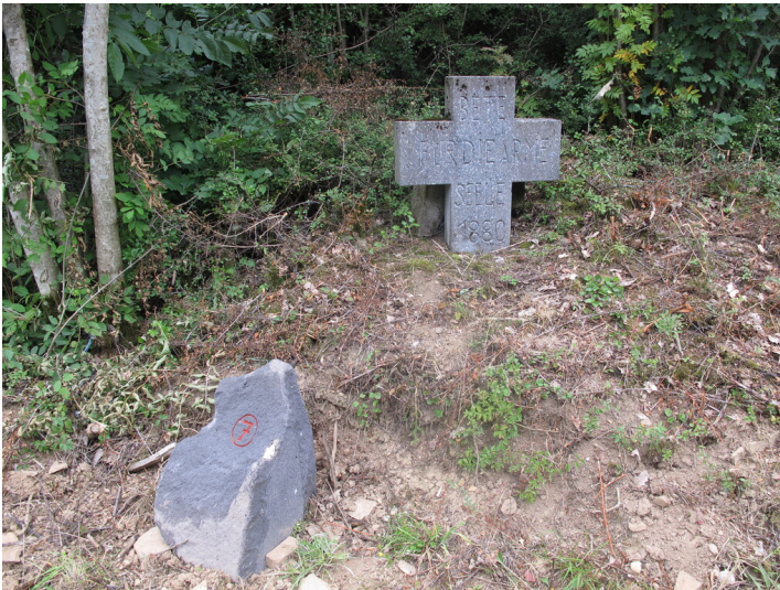
"Stoffels-Kreuz" Ulmen am Themenwanderweg (2011)