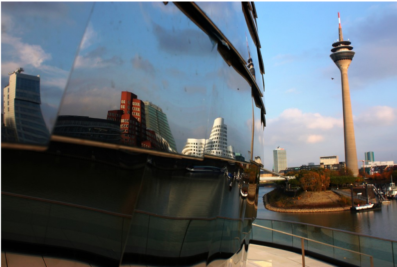
Sich in einer Glasfassade spiegelnde Gebäude im Bereich des Medienhafens Düsseldorf, rechts im Bild der 1978-1982 erbaute, 240,50 Meter Hohe Fernsehturm "Rheinturm" (2011)