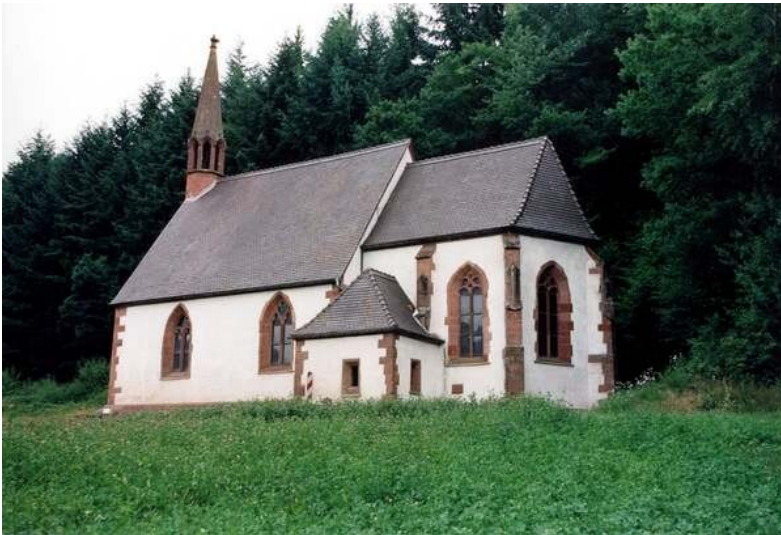
St. Anna-Kapelle bei Niederschlettenbach