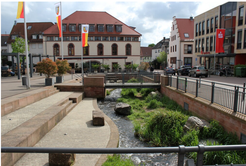
Schafplatz in Edenkoben