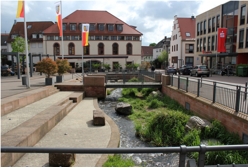
Schafplatz in Edenkoben