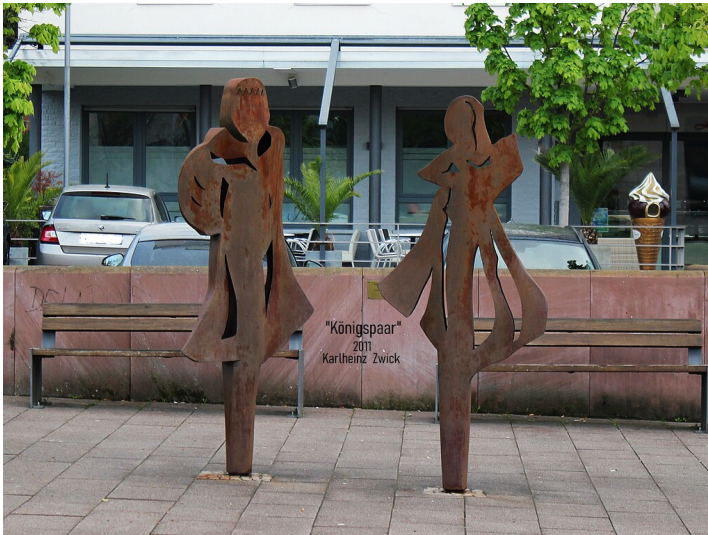
Kunst am Schafplatz in Edenkoben