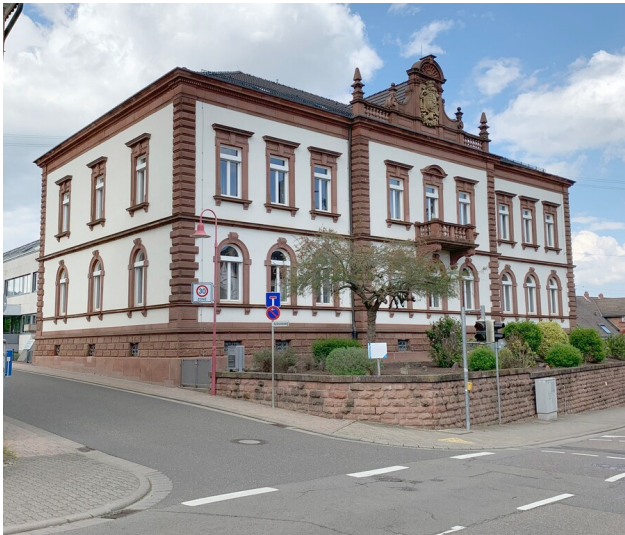
Ehemaliges Königl. Amtsgericht in Edenkoben (2023)