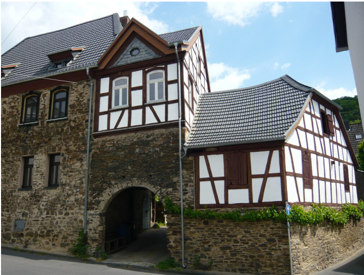
Werder Hof in Rheinbrohl (2015)