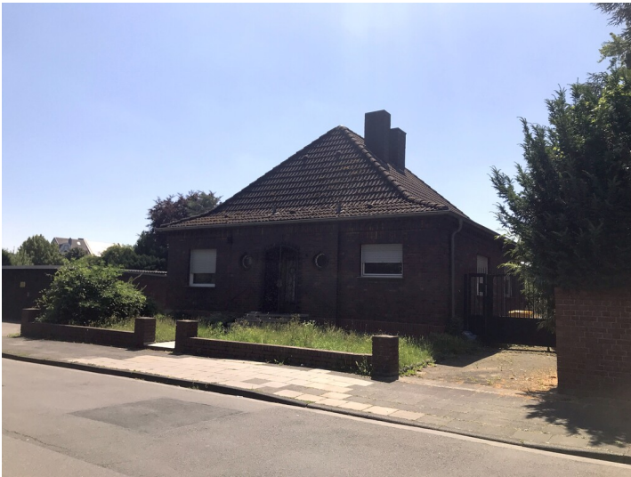
Fabrikantenwohnhaus der Tonwarenfabrik Kuckertz (2022)