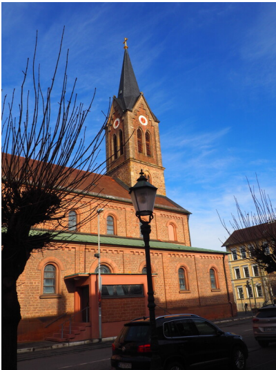
Seitenansicht mit Turm (2025)