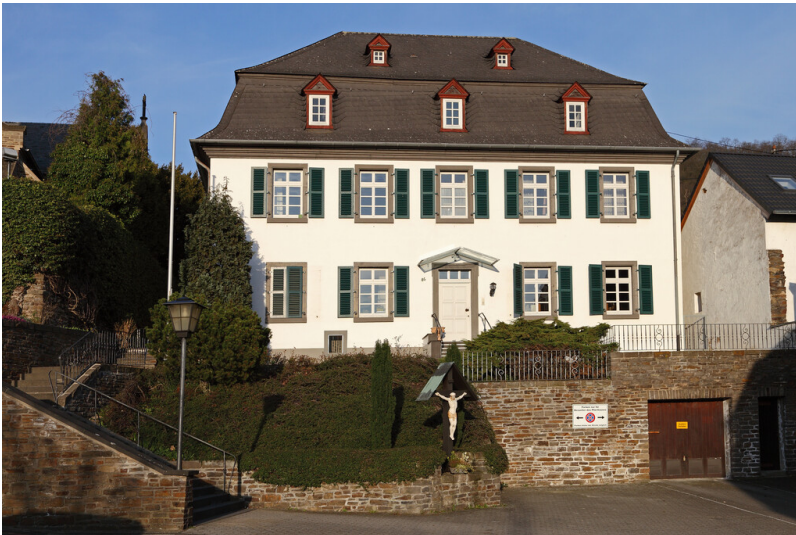
Prälatenhaus in Rheinbrohl (2011)