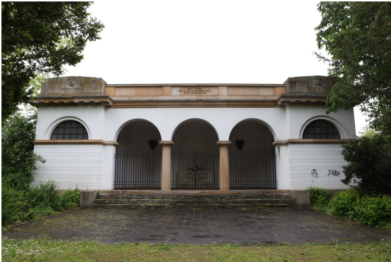
Gesamtansicht der Antikenhalle Speyer (2023)