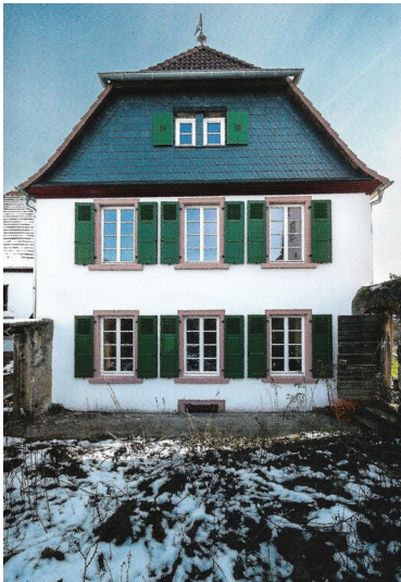
Stirnseite der fürstlichen Oberjägerei in der Neumayerstraße in Kirchheimbolanden (2023)