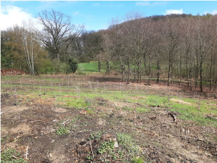
Neu angelegte Rahmholz-Demonstrationsfläche am Petersberg zur Rekonstruktion ehemaliger Niederwaldbestände im Siebengebirge (2022)