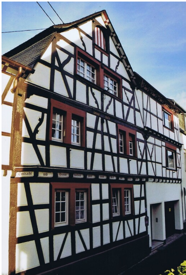
Haus Laacher in Bad Hönningen (2024)