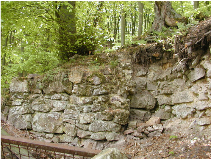
Turmrest im Westen der Anlage (2006)