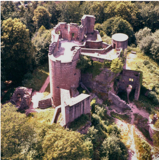
Luftaufnahme der Burgruine Neudahn