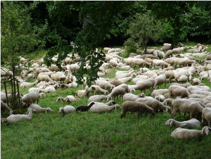
Mondscheinwiese am Petersberg im Siebengebirge mit Merinoschafen der Biologischen Station bei der Beweidung (2022)