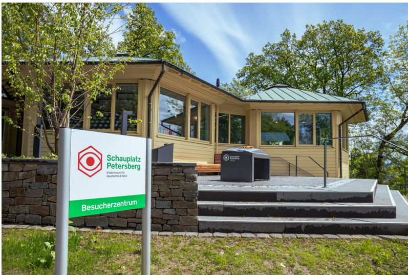
Ehemaliges Wachhaus auf dem Petersberg im Siebengebirge, heute Schauplatz Petersberg (2021)