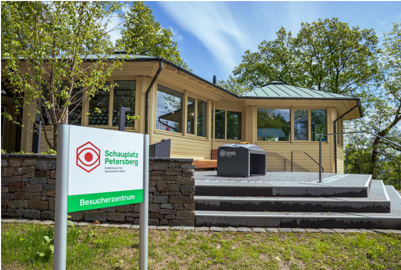
Ehemaliges Wachhaus auf dem Petersberg im Siebengebirge, heute Schauplatz Petersberg (2021)