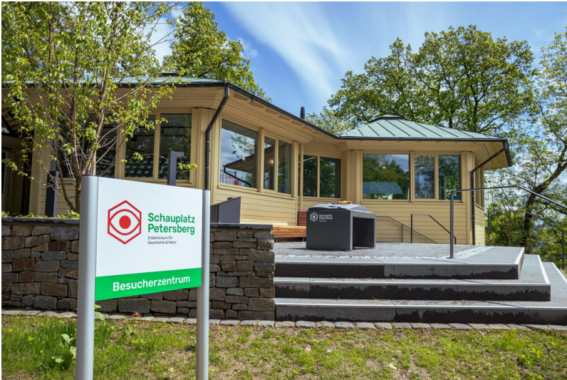
Ehemaliges Wachhaus auf dem Petersberg im Siebengebirge, heute Schauplatz Petersberg (2021)