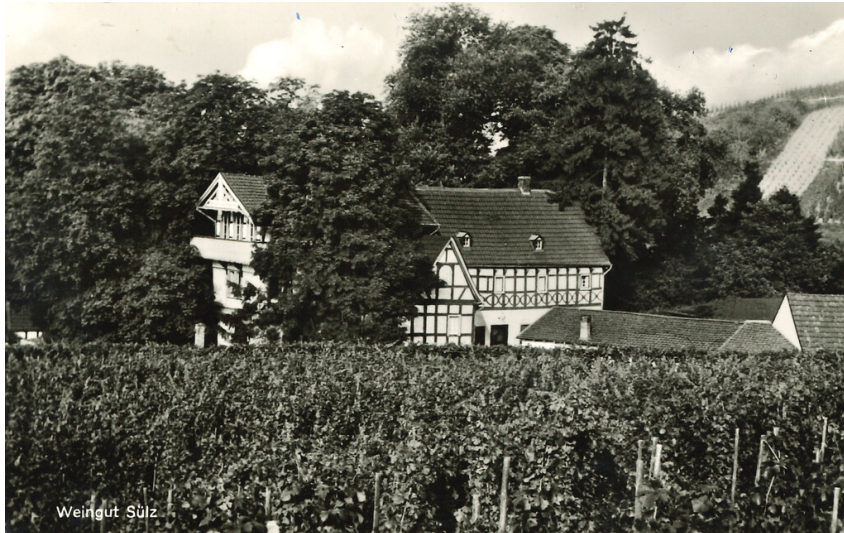
Blick über die Weinberge auf das Gut Sülz in Oberdollendorf. Ansichtskarte (1963).