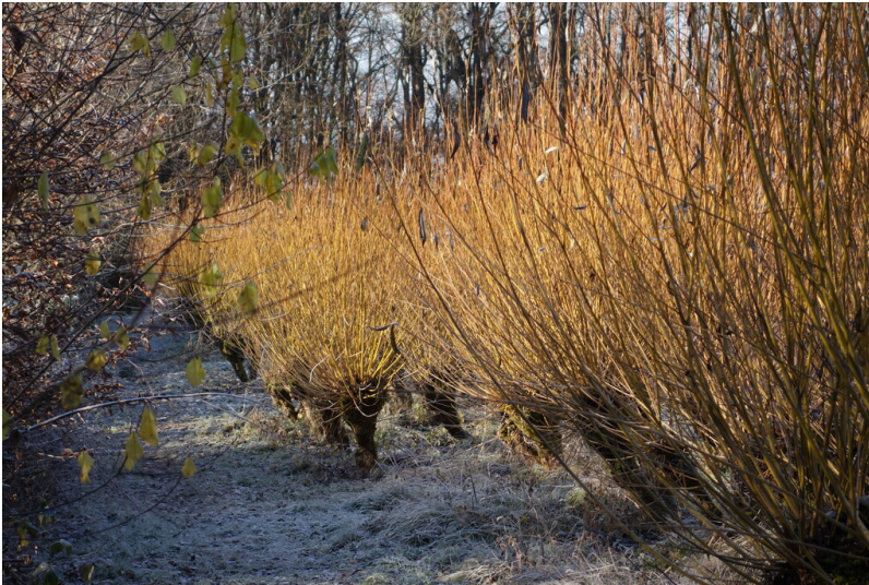
Weidenpflanzungen des Weinguts Blöser oberhalb der Hülle in Oberdollendorf, Königswinter (2022)