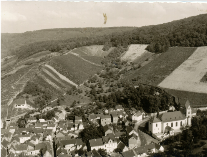
Die Weinberge rund um die Hülle in Oberdollendorf kurz vor der Flurbereinigung. Fotografie (1978)