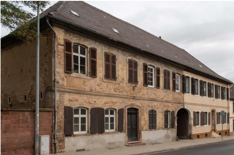
Die ehemalige fürstliche Kaserne in der Neumayerstraße in Kirchheimbolanden (2023)