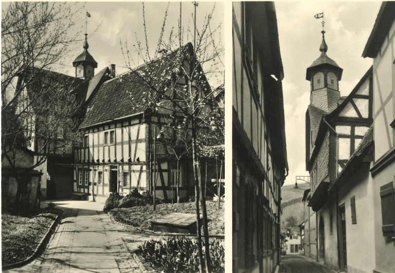
Turmhof in Oberdollendorf. Ansichtskarte (um 1935).