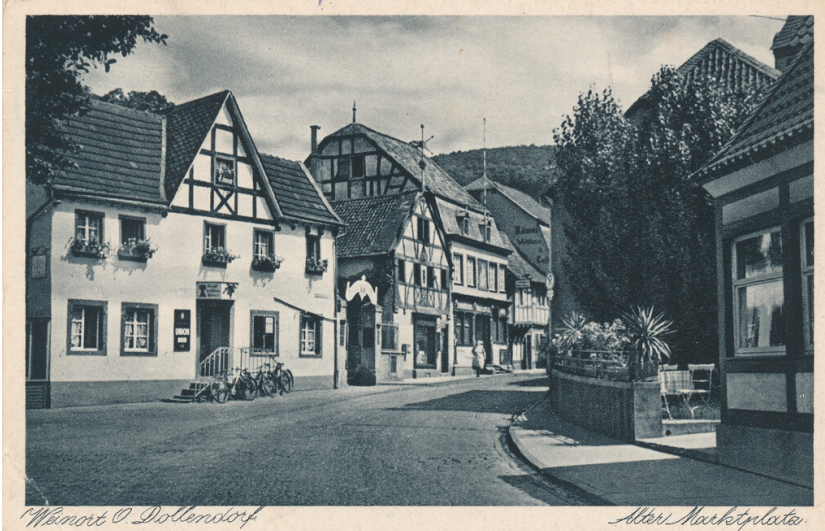
Ansicht des ehemaligen Gebäudes des Winzervereins in Oberdollendorf. Ansichtskarte (um 1910)