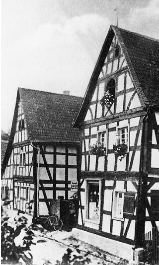
Ehemaliges Winzerhaus in der Bergstraße 10 in Oberdollendorf. Fotografie (vor 1940).