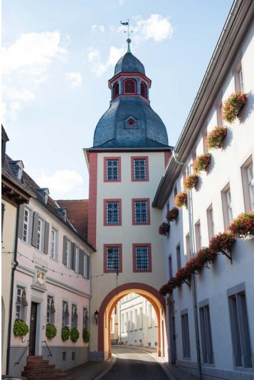
Der Torturm Oberes Stadttor in Kirchheimbolanden (2023)