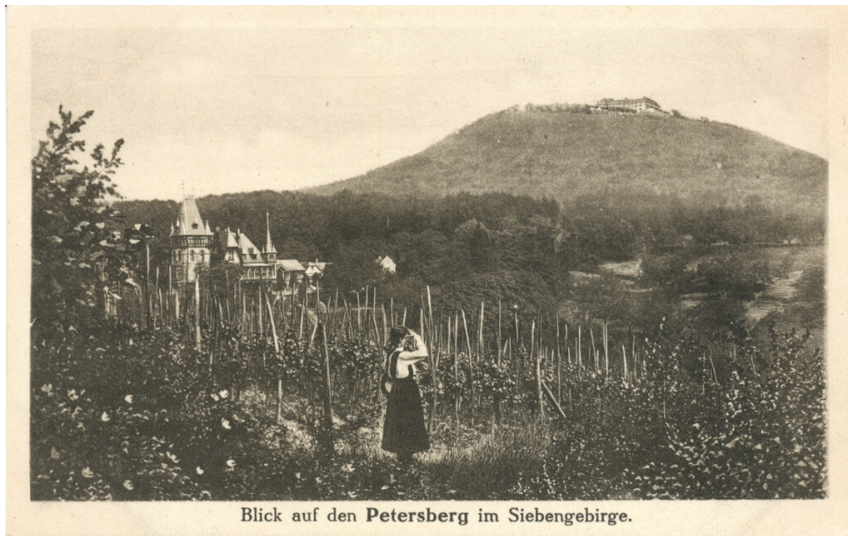
Blick auf den Petersberg im Siebengebirge.

Blick auf den Petersberg im Siebengebirge, im Vordergrund Haus Heisterberg. Ansichtskarte (um 1910).