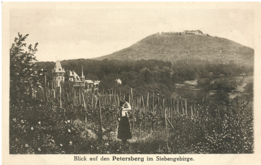
Blick auf den Petersberg im Siebengebirge.

Blick auf den Petersberg im Siebengebirge, im Vordergrund Haus Heisterberg. Ansichtskarte (um 1910).