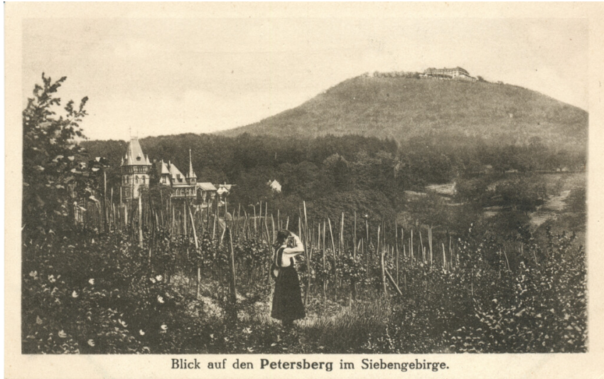
Blick auf den Petersberg im Siebengebirge.

Blick auf den Petersberg im Siebengebirge, im Vordergrund Haus Heisterberg. Ansichtskarte (um 1910).