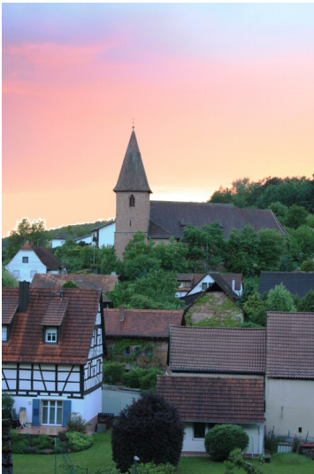
Katholische Kirche St. Laurentius Niederschlettenbach (2019)