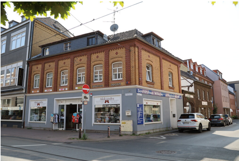
Wohn- und Geschäftshaus des Steinzeugfabrikanten Gottfried Hendrickx (2024)