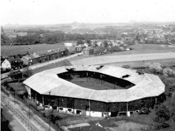
Historische Aufnahme der 1932/33 erbauten, bis um 1940 genutzten und 1952 abgerissenen Radrennbahn Holz in Herzogenrath-Straß (undatiert, Ansicht von Süden).